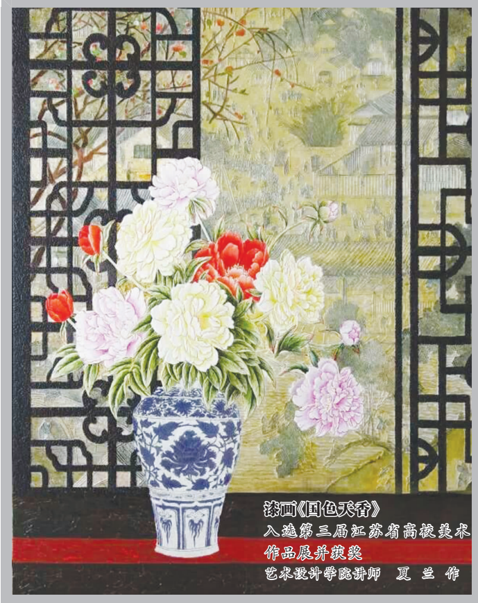
国画《国色天香》 入选第三届江苏省高雅美术 作品展览并获奖 艺术爱好者学院讲师 夏兰作