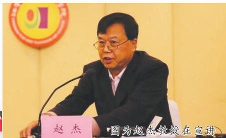
图为赵杰教授在宣讲

12月8日下午，无锡市委宣讲团成员，无锡市文广新局党组书记、局长杨福良来到江影，以《不忘初心，牢记使命，深入学习贯彻党的十九大精神》为题，为200多名师生专题宣讲党的十九大精神。江影党委书记、董事长卢国忠主持宣讲报告会。全体校领导、党委委员、全体教职工、各二级学院学生代表(发展对象)听取了宣讲。