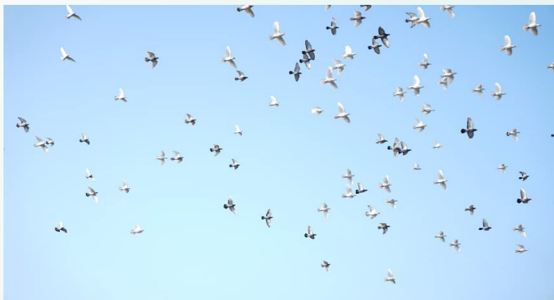
25 多拉罗嗣千 - 飞鸟

我们深刻认识到,国家安全,人人有责,人人可为。今后,我们会把国家安全牢记于心,外化于行,主动做国家安全的学习者、宣传者、守护者,用心守护家国安宁,让五星红旗永远迎风飘扬。