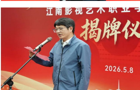
江南影视艺术职业学院实训基地揭牌仪式