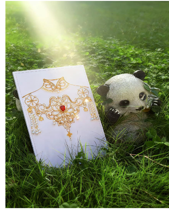
《珠帘玉幕》 21 高职表演艺术班徐泽贤、朱新月