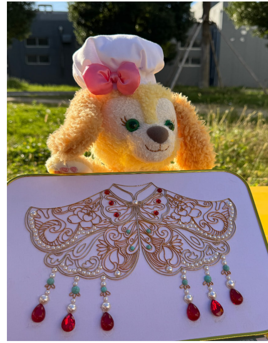
《红玉》 21 高职表演艺术班陈曼之 丰诗佳