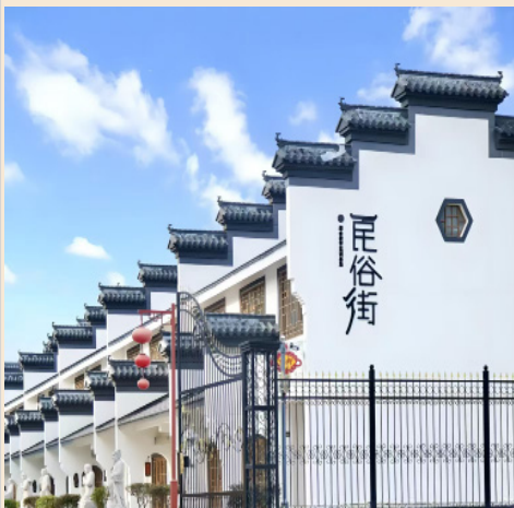
教艺 92332- 程程辉 - 小镇

胆改写负面标签 走进反标签涂鸦墙,把困扰自己的负面标签写在墙上,用彩笔、颜料在标签上创作——将“内向社恐”改写为“温柔细腻”,把“笨手笨脚”涂改成“勇于尝试”,用涂鸦的方式,直观地打破标签的定义,在创作中看见自己的多面性。