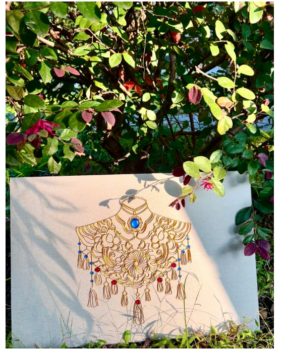
《云想衣裳》 21 高职表演艺术班陆雨濛、徐西贝