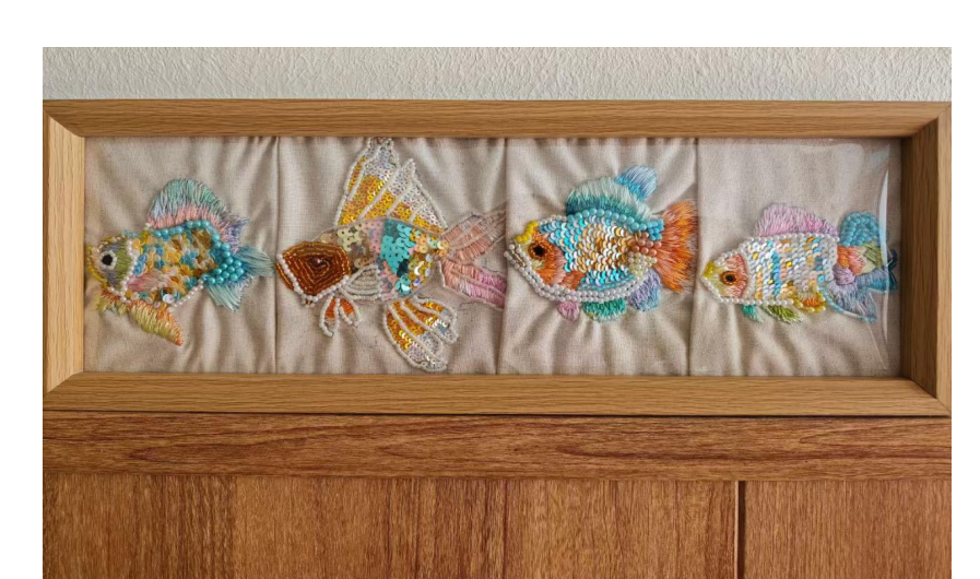
《鱼生》2501 幼儿 杨梦然、刘可欣、冯子轩、王少琪