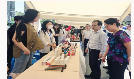
（图为无锡市委教育工委书记、市教育局局长宋新春在活动现场与我校师生交流）

在展示活动现场的文艺表演中，我校怡馨曲艺社同学表演的相声《脱单指南》，以轻松幽默的形式传递了积极向上的价值导向，包袱不断，寓教于乐。在体验活动开展位前，我校“惠泥守艺·造物疗心”非遗体验活动吸引了不少市民驻足围观。师生指导市民亲手勾勒线条、描摹配色，感受国家级非物质文化遗产——惠山泥人传统工艺的独特魅力。活动现场还展出了师生团队创新开发的惠山泥人与空乘职业形象融合的“空港锡韵·江影云乘”系列IP文创作品，将传统文化与现代审美创意有机融合，吸引众多市民朋友驻足、体验、点赞。