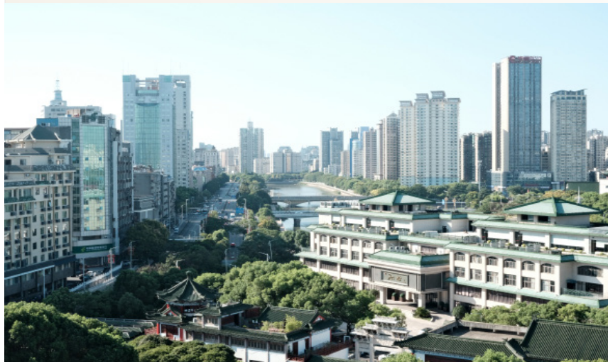
《豫章风物图》2401 编号 3+2 沈卿宇

辅导员的志向，是守护每一位学生的成长，而这份志向，需要用脚踏实地的行动去践行。记得一个寒冷且下雨的凌晨三点，一阵急促的电话铃声划破寂静，电话那头是张同学痛苦的呻吟：“老师，我肚子好痛，疼得直不起腰，全身无力……”我瞬间清醒，顾不上穿外套就冲出宿舍，一边拨打 120，一边赶往学生